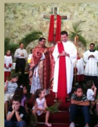
Domingo de Ramos